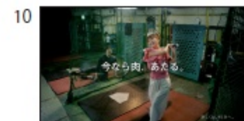
鈴木さん: カンタン！ Title: 今なら肉、あたる。