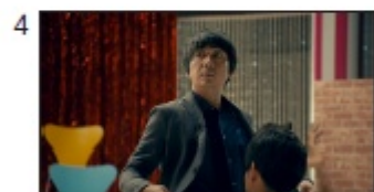
スタイリスト、AD: まじっすか へ～ い～な～