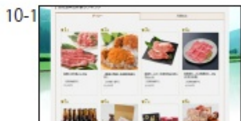
NA: カンタンふるさと納税サイト