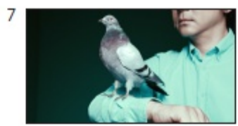
SE: クルクーク クルクーク