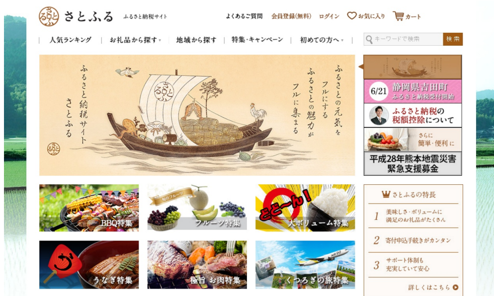
「さとふる」( http://www.satofull.jp/ ) イメージ

「さとふる」は、株式会社さとふるが運営する、地域活性化への貢献を目指したふるさと納税サイトです。「ふるさとの元気を“フル”にする、ふるさとの魅力が“フル”に集まる」をコンセプトに、サイト内で寄付先の自治体やお礼品の選定、寄付の申し込み、寄付金の支払いまでをワンストップでできるサービスを提供しています。ふるさと納税を「カンタン」にできるサービスを提供することで、多くの方々に気軽に地域を応援してもらうことを目指しています。「さとふる」は2014年10月31日にオープンし、2016年6月23日現在、約90自治体と提携しています。