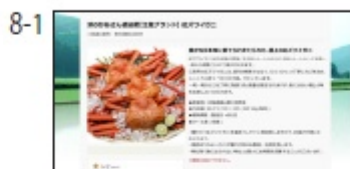
NA: カンタンふるさと納税 サイトは