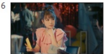
鈴木さん: あっ、はとふるだっ たかな？