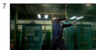
大森さん: なにそれー！！