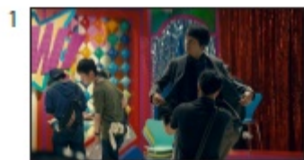
鈴木さん: 本当カンタンなの