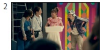
ネットでふるさと納税！