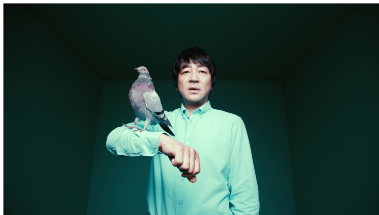
『サルとハト』篇より