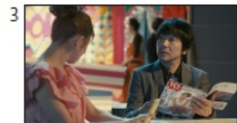
大森さん: さるふる？